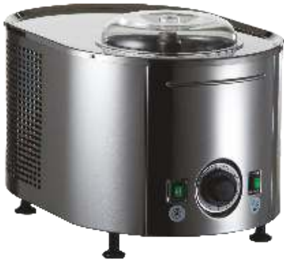
MINI GELATIERA DA CASA HOME ICE CREAM MACHINE