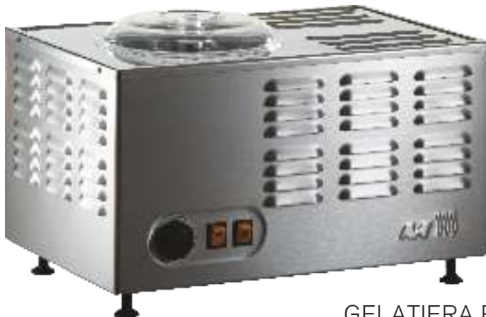
STELLA GELATIERA PROFESSIONALE E DA CASA PROFESSIONAL AND HOME ICE CREAM MACHINE